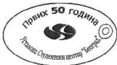
Предња страна жетона