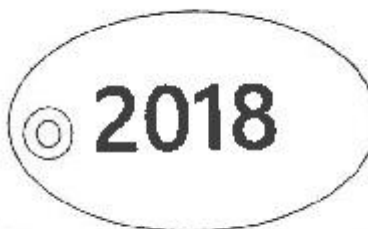
Задња страна жетона